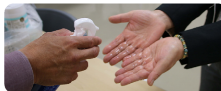
全員にアルコール除菌を行ってからの入室