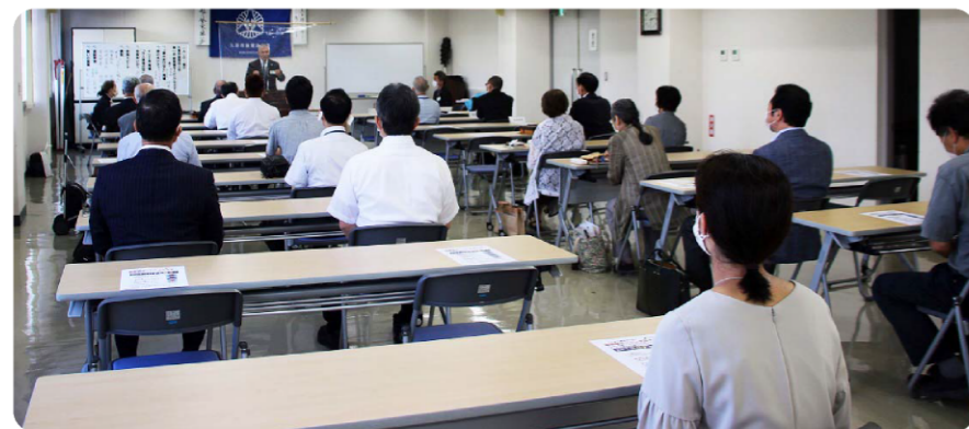
「3密」にならないよう留意しながら行ったセミナー