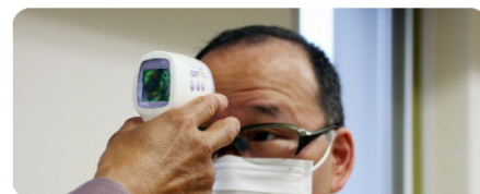
マスク確認と電子体温計で計測してからの入室