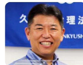
R2.8.11(久喜市・市長) 梅田修一氏