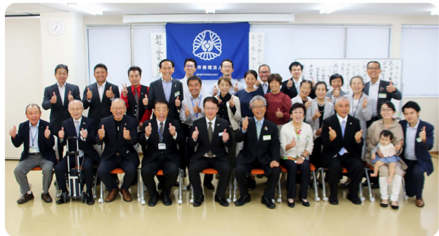
「新型コロナウイルス感染症」にも笑顔で戦う会員の面々